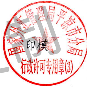
国家外汇管理局平凉市分局 行政许可专用章（3）