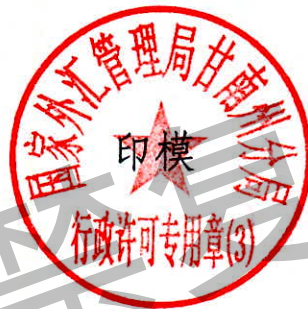
国家外汇管理局甘南州分局 行政许可专用章（3）