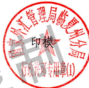
国家外汇管理局临夏州分局 行政许可专用章（1）