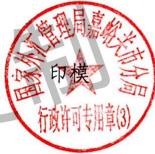
国家外汇管理局嘉峪关市分局 行政许可专用章（3）