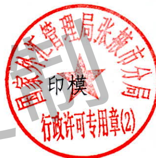
国家外汇管理局张掖市分局 行政许可专用章（2）