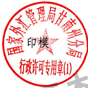
国家外汇管理局甘南州分局 行政许可专用章（1）