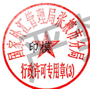
国家外汇管理局张掖市分局 行政许可专用章（3）