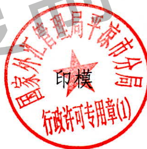
国家外汇管理局平凉市分局 行政许可专用章（1）