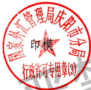
国家外汇管理局庆阳市分局 行政许可专用章（3）