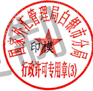
国家外汇管理局白银市分局 行政许可专用章(3)