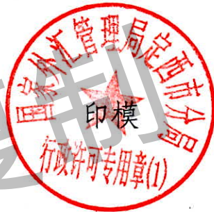
国家外汇管理局定西市分局 行政许可专用章（1）