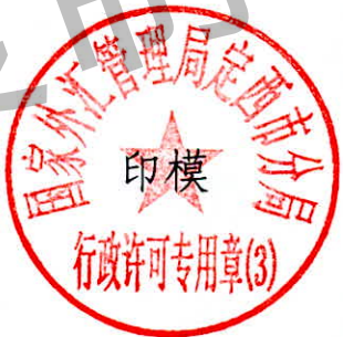
国家外汇管理局定西市分局 行政许可专用章（3）