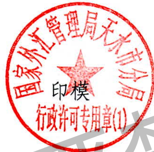
国家外汇管理局天水市分局 行政许可专用章(1)