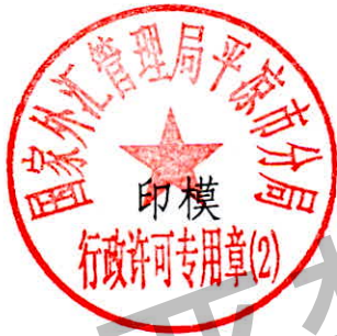
国家外汇管理局平凉市分局 行政许可专用章（2）