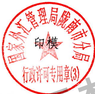
国家外汇管理局陇南市分局 行政许可专用章（3）