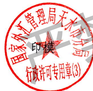
国家外汇管理局天水市分局 行政许可专用章(3)