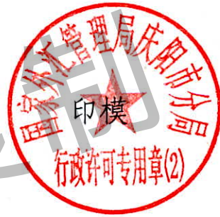
国家外汇管理局庆阳市分局 行政许可专用章（2）