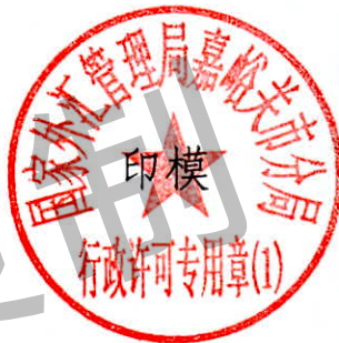
国家外汇管理局嘉峪关市分 局行政许可专用章（1）