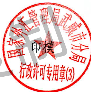
国家外汇管理局武威市分局 行政许可专用章（3）