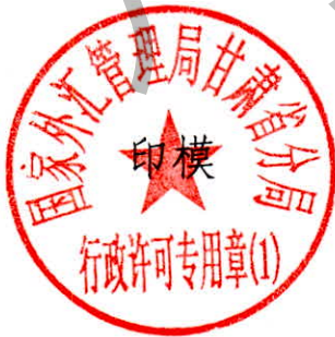
国家外汇管理局甘肃省分局 行政许可专用章（1）