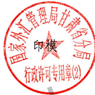
国家外汇管理局甘肃省分局 行政许可专用章（2）