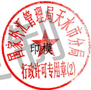
国家外汇管理局天水市分局 行政许可专用章(2)