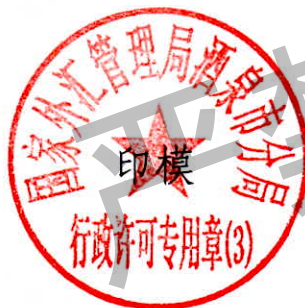
国家外汇管理局酒泉市分局 行政许可专用章（3）