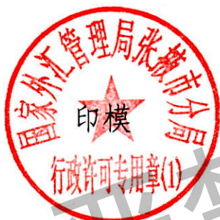
国家外汇管理局张掖市分局 行政许可专用章（1）