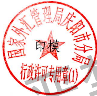
国家外汇管理局庆阳市分局 行政许可专用章（1）