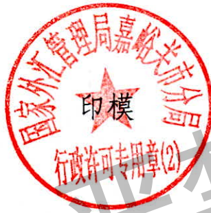
国家外汇管理局嘉峪关市分局 行政许可专用章（2）