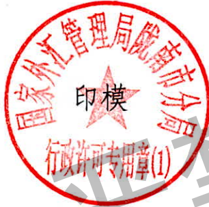
国家外汇管理局陇南市分局 行政许可专用章（1）