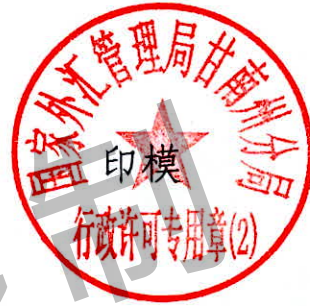
国家外汇管理局甘南州分局 行政许可专用章（2）