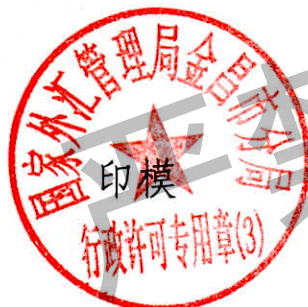
国家外汇管理局金昌市分局 行政许可专用章（3）