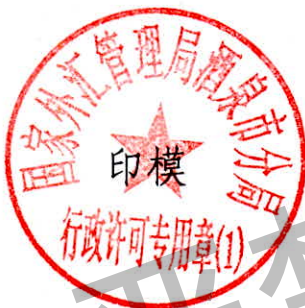
国家外汇管理局酒泉市分局 行政许可专用章（1）