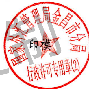
国家外汇管理局金昌市分局 行政许可专用章（2）