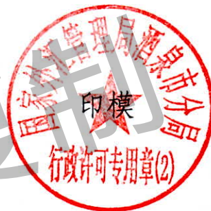
国家外汇管理局酒泉市分局 行政许可专用章（2）