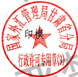
国家外汇管理局甘肃省分局 行政许可专用章（3）