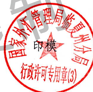
国家外汇管理局临夏州分局 行政许可专用章（3）