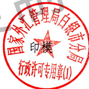
国家外汇管理局白银市分局 行政许可专用章（1）