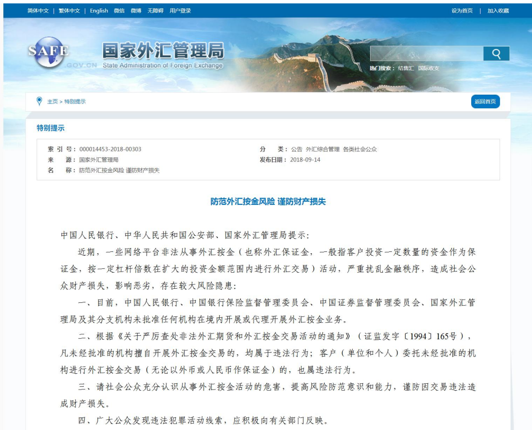
图 3 会同中国人民银行、公安部联合发布题为《防范外汇按金风险 谨防财产损失》的风险提示